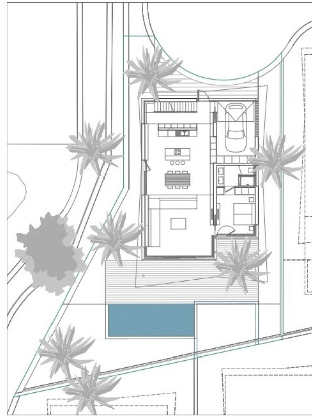
URBANIZATION / URBANIZACIÓN