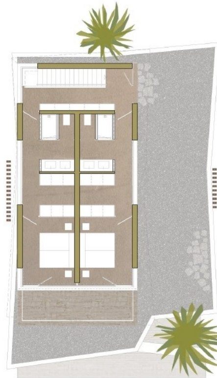
UPPER FLOOR / PLANTA ALTA